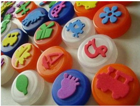
Рисование штампами, купленными в магазине