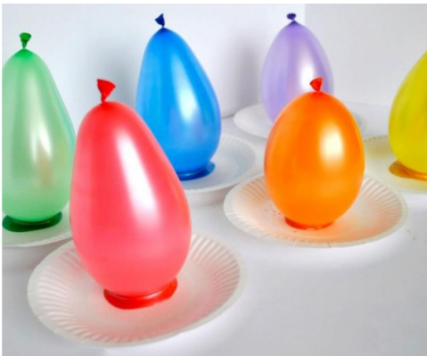
Рисование оттисками воздушных шариков