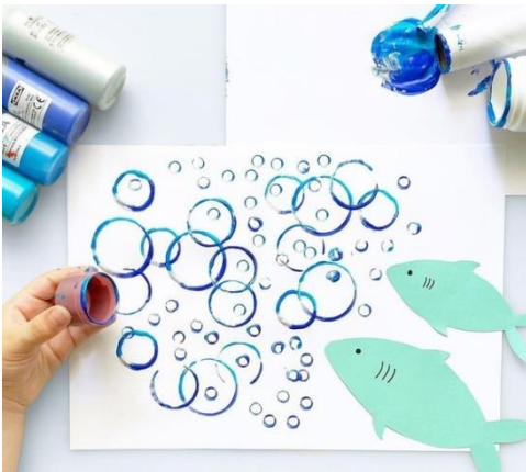
Рисование баночками, крышками, пластиковыми или бумажными стаканчиками